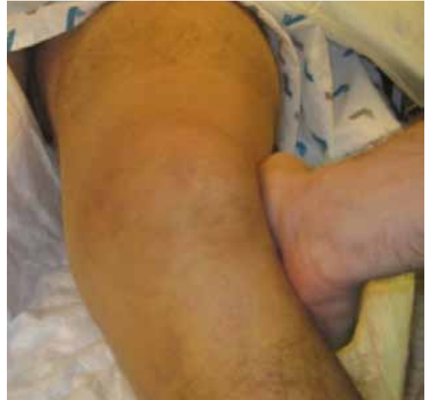
Figure 5. Valgus stress