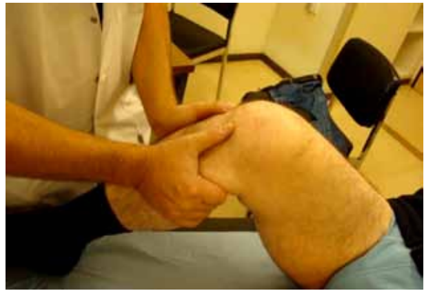
Figure 8. À 90° testing LCA et LCP

Le ligament croisé postérieur s'évalue à 90° de flexion par son tiroir postérieur et par l'avalement de la TTA.