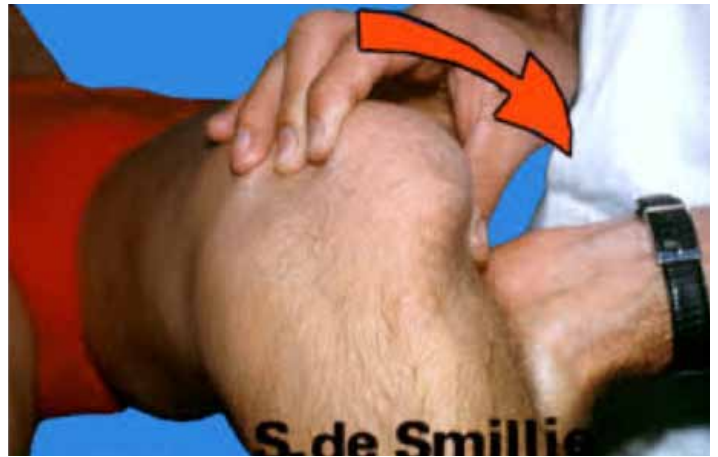
Figure 1. Smilie Test

Une raideur et douleur à la mobilisation de la hanche ( Figure 2 ) est suggestif d'une douleur rapportée au genou ce qui constitue clairement un piège. Il n'est pas rare que certains patients se plaignent du genou alors que c'est la hanche qui est pathologique.