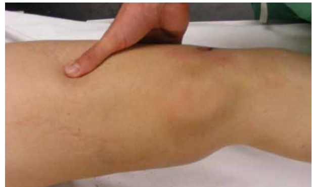
Figure 6. varus stress

Ces tests consistent à mettre les structures en tension. En fonction du nombre de millimètre d'ouverture, l'instabilité est graduée en stade allant de 0 à III