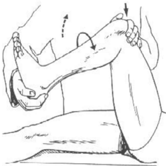
Figure 4. Test de Mac Murray

Les tests de stabilité sagittaux, frontaux et rotatoires permettent de confirmer une atteinte ligamentaire ou multi ligamentaire et capsulaire.