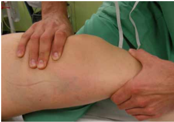
Figure 7. Lachman