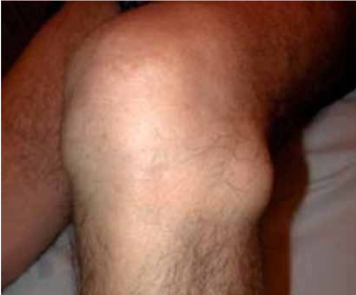
Figure 3. Kyste arthro-synovial